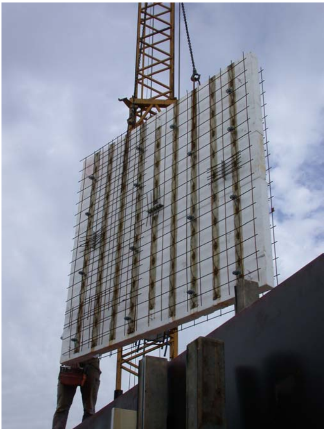
Principedetail Iconorm sandwichelement

Maar het beste resultaat wordt behaald met een batterijbekisting voor wanden. Hiermee wordt voorkomen dat er gaten in de wandelementen van de opspanners zitten. De batterijbekisting wordt namelijk alleen aan de buitenzijde opgespannen, waardoor de wanden intact blijven, zonder koudebruggen en luchtlekken te veroorzaken.